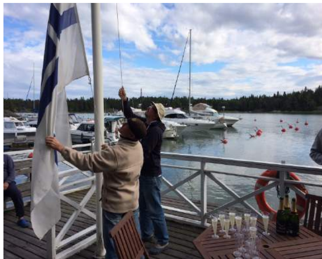
Lipunnosto Villahdessa juhannuksena2014

Juhannusjuhlaa vietetään seuramme tukikohdissa Villahdessa ja Norrvikissa 19.6. oheisen alustavan ohjelman mukaan: