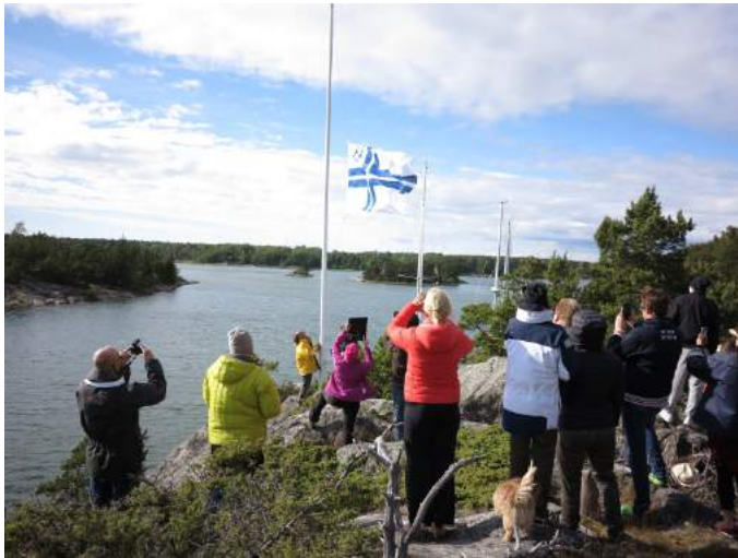
Lipunnosto Norrvikissa juhannuksena 2014