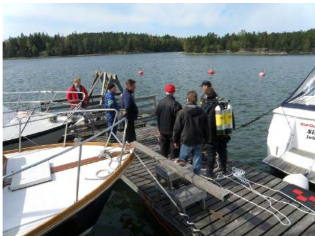
Hyvin suunniteltu on puoliksi tehty...