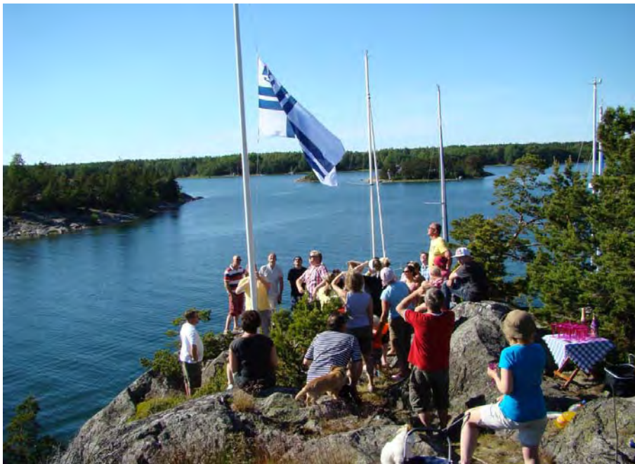
Ensimmäinen lipunnosto Norrvikissä juhannuksena 2012

Juhannusjuhlaa vietetään seuramme tukikohdissa Villahdessa ja Norrvikissa oheisen alustavan ohjelman mukaan: