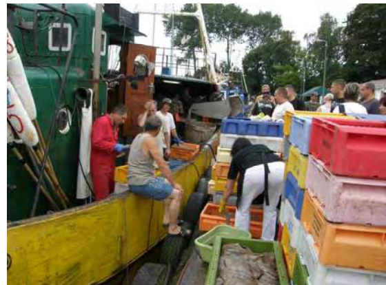
Kalanostajia Dziwnowin satamassa

Aamulla taas ulapalle. Sattui kuitenkin pieni viivästys kun keulapotkuri ei suostunut toimi-maan. Se on aika tärkeä varuste kun 15 t painava vene yritetään kääntää ahtaassa sata-ma-altaassa. Poranterästä tein uuden sokan ja taas oli pelit kunnossa. Melkein tyynessä kelissä suunnattiin kohti länttä. Poikettiin Uts-kan satamassa jossa oli käynnissä vieras-venesataman saneeraustyö. Ensi kesänä siel-lä on sitten iso ja komea satama. Yöpymis-kohteeksi valittiin Darlowo. Ennen varsinaista satamaa on avattava silta. Se aukeaa joka täysi tunti ja suunnilleen vartin odotuksen jäl-keen päästiin satamaan. Satamakapteen-ska tuli sanomaan, että täällä ei saa kiinnittyä. Kesti jonkin aikaa ennen kuin tajuttiin, että hän tarkoitti, että useamman veneen rinnakkain kiinnittyminen ei ole joen kapeuden takia sal-littu. Taas olimme pikkukaupungissa joka oli yli äyräittänsä täynnä turisteja. Yö oli rauha-ton. Ihmiset kävelivät pitkin laituria ja juopu-neet pitivät meteliä veneen vieressä. Kolmen aikaan yöllä heräsin siihen, että veneemme takakannella istui ihmisiä juomassa ”virvok-keitaan”. Aamulla sillan avattua lähdettiin taas merelle.