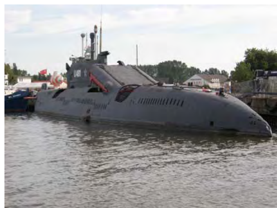
Museosukellusvene Peenemünden satamassa