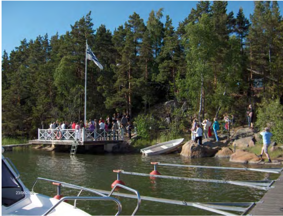
Lipunnosto Villahdessa Juhannuksena 2006