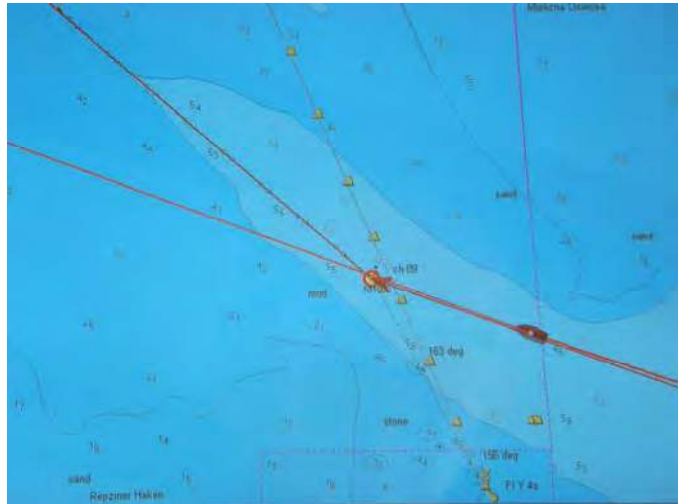
Saksan rajan ylitys