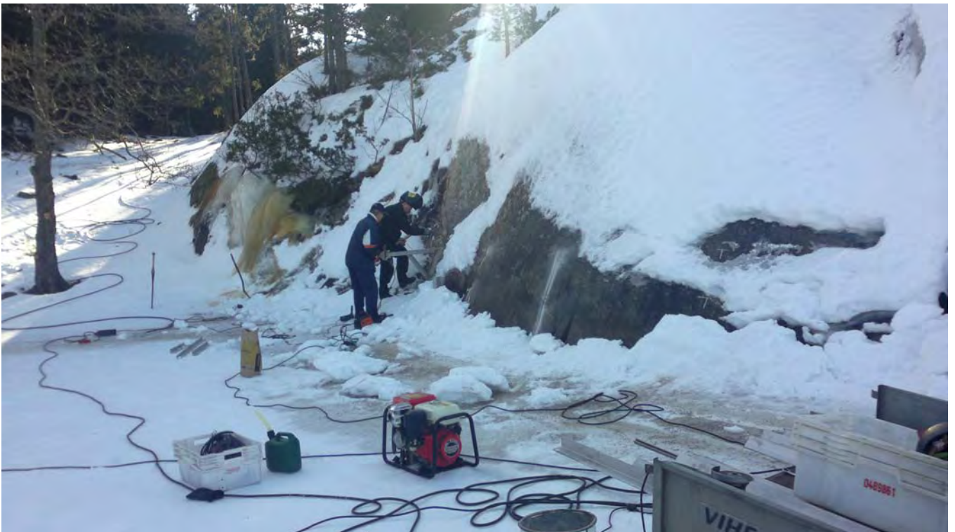
Laiturikannakkeiden kiinnittämistä 6.3.2012