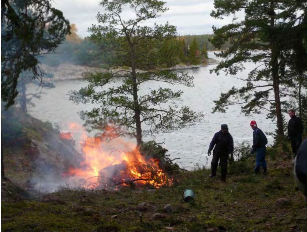
Rakennuspaikan raivausta 15.10.2011

kot, talomaalit, sähkökeskus, maakaapelia 180m, eristevillat, tuulensuojalevyt, lippu- tanko, yhteysveneen perämoottori, sekä paljon muuta pienempää tärkeää rakennusta- varaa.