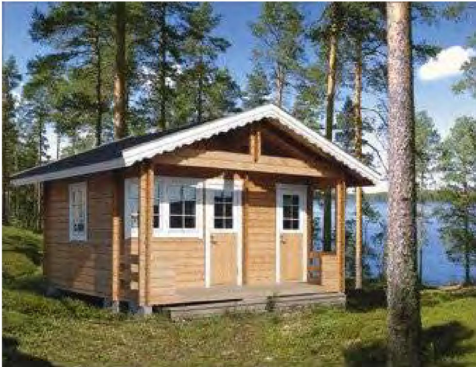
Tällainen saunamökki on hankittu – Metsola 20

Tämän ilmestyessä pitäisi saunamökin olla jo pystyssä ja laitureiden kansilautojen ja poijujen paikoillaan.