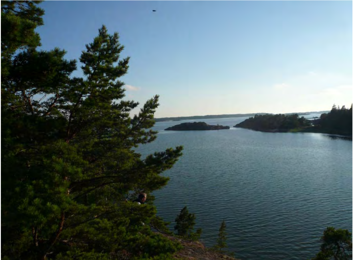
Näkymä lounaaseen ylhäältä kalliolta