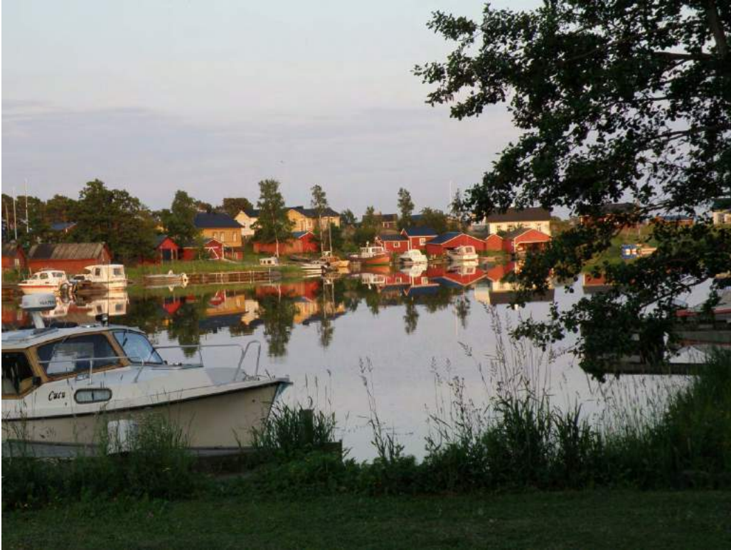
Haapasaari heinäkuu 2011