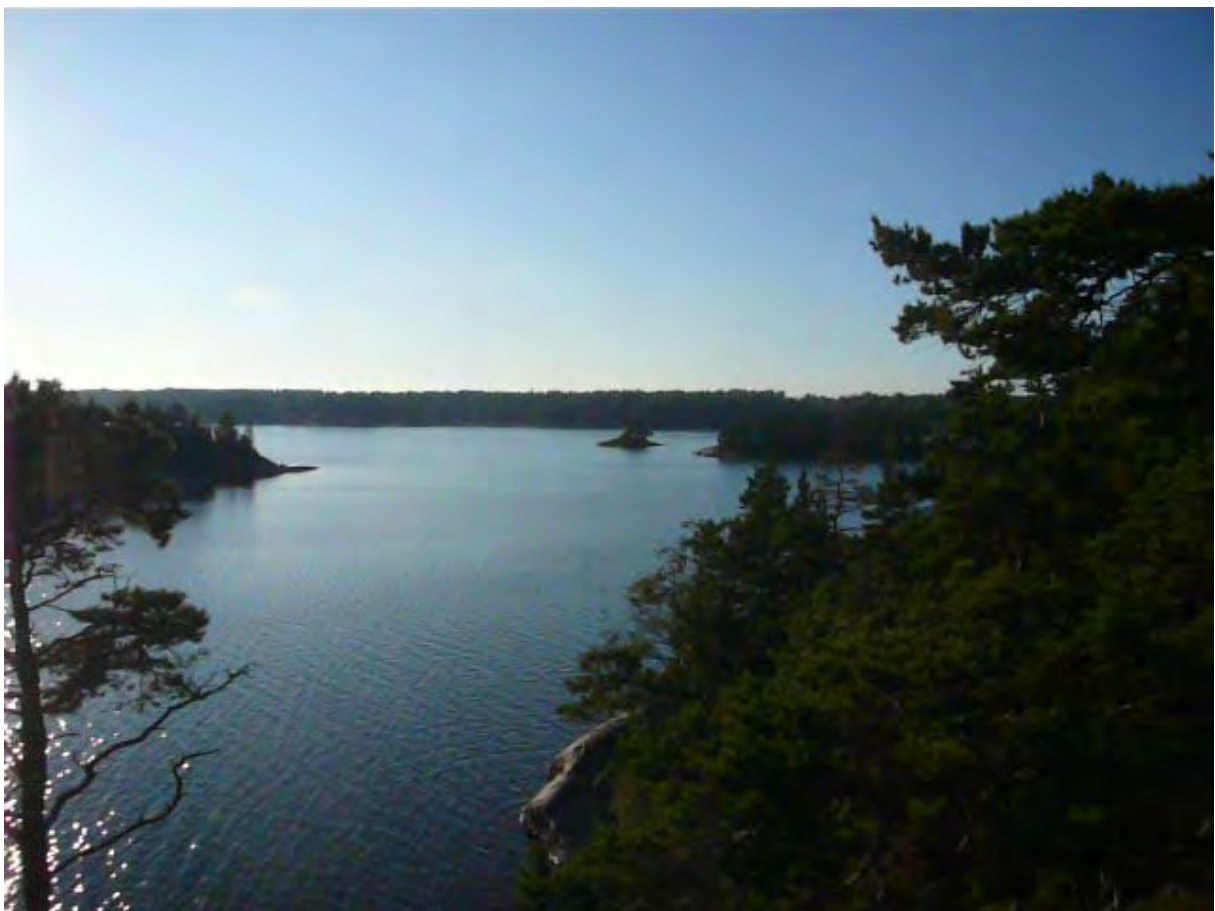
Näkymä pohjoiseen ylhäältä