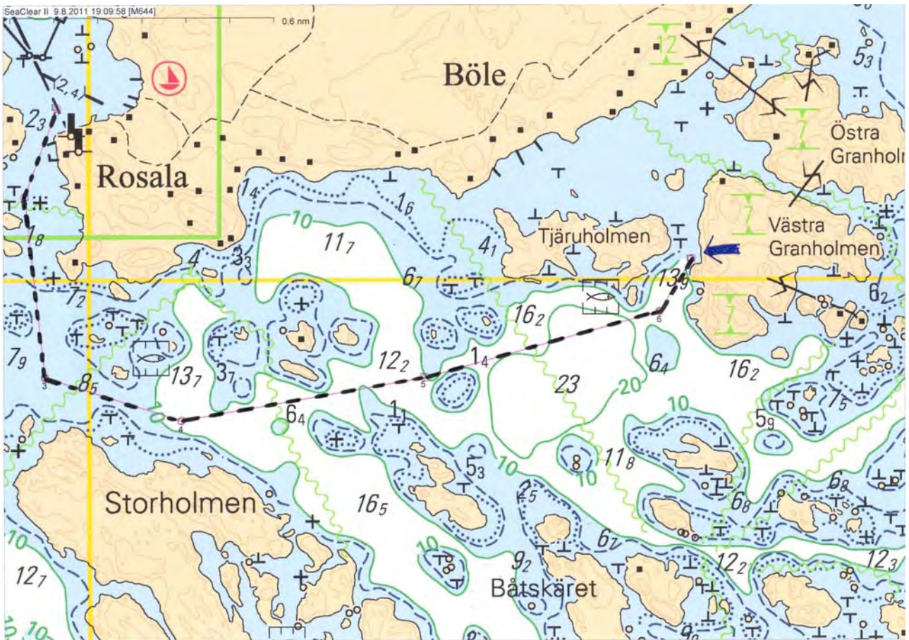
Merikortti 644 ja alustava reitti Rosalasta