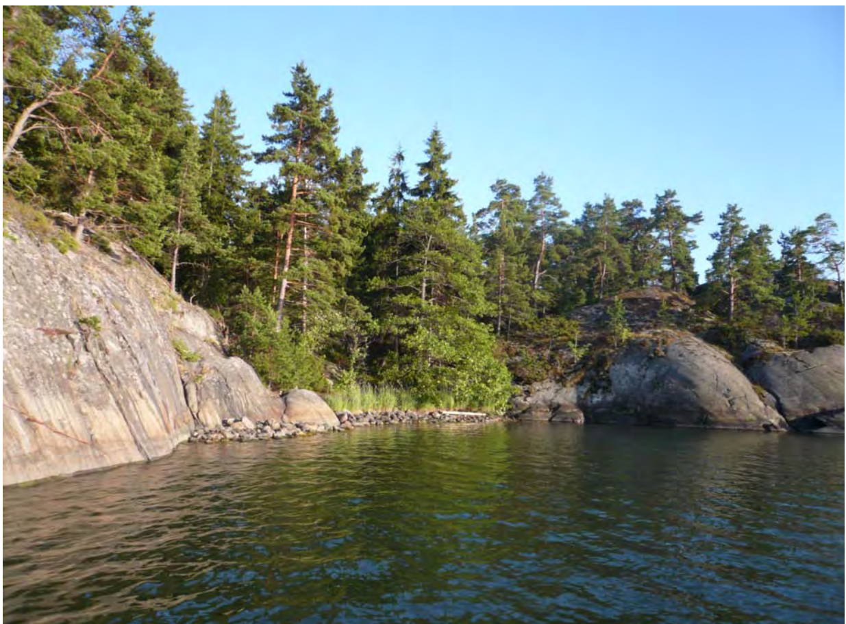
Kalliorantojen välinen sola